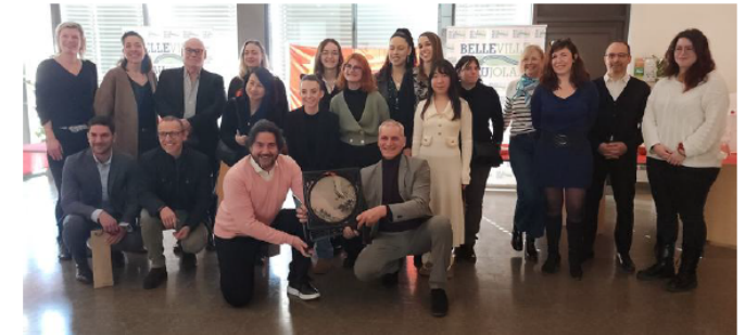
La salle du conseil municipal a été le théâtre de la première célébration du Nouvel an chinois connecté, à Belleville-en-Beaujolais.

La célébration du Nouvel an chinois par le campus connecté, mercredi 14 février, à la mairie de Belleville-en-Beaujolais, est la première manifestation concrète du pacte d'amitié entre la Communauté de communes Saône Beaujolais (CCSB) et Changshu, une ville chinoise.